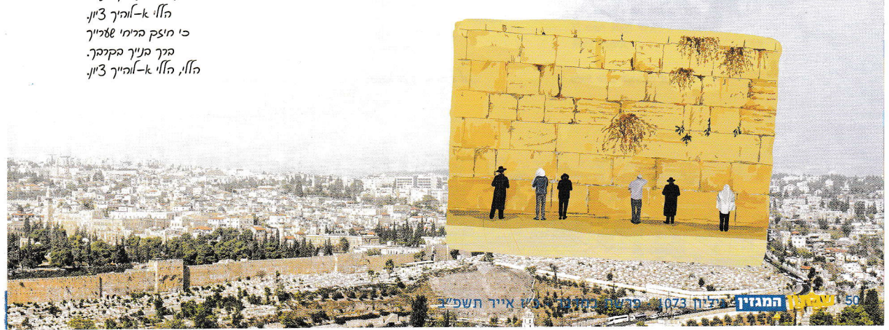
50 עמודים המגזין | יולי 2023 | פרשת תולדות | איור תשמ"ב

מילים: מן התפילה | לחן: אביו מדינה שבחי ירושלים אג ד' הלל א-א-הייך ציון. כי חישב בימי שליך מך טיך הקיבך. הלל, הלל א-א-הייך ציון.