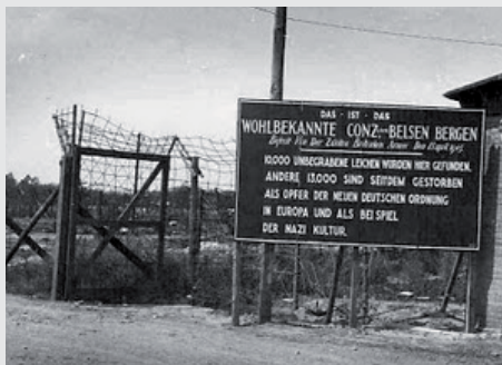
שער הכניסה למחנה 'בלזן-ברגן'

ומדוע לא תביני? הרי לא היו שם רק שופטים, היה נאום תביעה והיה מוכן גם סניגור, וגם מזכיר היה שם שישב ורשם את הפרוטוקול, כל מילה שהייתי אומרת היתה מיד נרשמת על ידי המזכיר. ומי הוא המזכיר? יהודי! והיה זה כבר לאחר כניסת השבת! שתקתי, אמרתי לעצמי, מוטב לרעוב קצת יותר, מאשר לגרום לכך כי יהודי יכתוב ויחלל שבת!