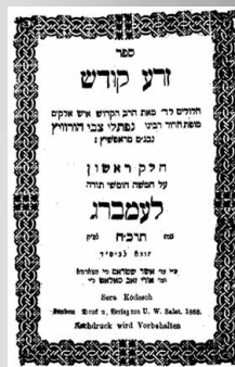
שער ספרו 'זרע קודש'

זהו איפוא כוונת התורה, "ששת ימים תעשה מלאכה", שבימות החול תעשה מלאכה בעבודת ה' בשלימות, כדי שהם יוכלו להקרא "ששת ימים", ועל ידי כך "וביום השביעי יהיה לכם קודש שבת שבתון".