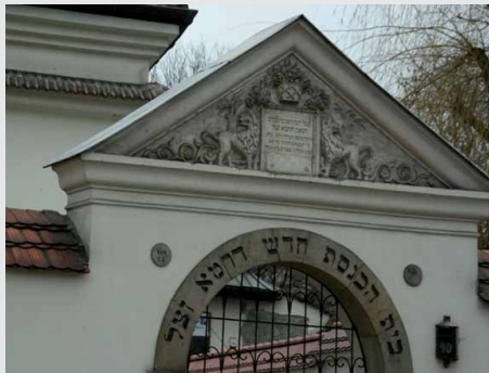
שער הכניסה לביה"כ הרמ"א זצ"ל בקראקא

ולהביא לידי תוצאות רצויות כדי שאותה בת ישראל עניה ויתומה, לא תצא עם בושת פנים. במשך שעתים עמל הרמ"א עצמו ליישב את ההדורים, עד ששעתים לאחר ירדת החושך על קראקא, הצליח להביא לתוצאות המקוות, הוסיף משולו עוד התחייבות, הצליח להוציא מקרובי הכלה עוד התחייבות, וכך הצליח גם להוציא ויתור קל מהחתן, ולמרבית הפלא, ולמול עיניהם המשתאות של נכבדי העיר קראקא, קם הרמ"א ועשה מעשה, ובליל שבת עמד וערך את הקידושין לאותו זוג, ונכנסו לחופה, ורק לאחר מכן הלך הרמ"א לבית מדרשו, שם התפלל עם תלמידיו תפילת ערבית, כשלאחר מכן חזר לפאר את סעודת המשתה של החתן והכלה שנחוגה בשמחה גדולה.