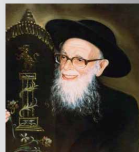
הגאון רבי שלמה זלמן

כמה סמולי הדבר, שבעת אשר חלה הגרש"ז זצ"ל את חליו האחרון שממנו הסתלק בחסות, והוצרך להתאשפז בבית מרפא, היה זה ביום חמישי בשבוע, וכאשר הגיע האמבולנס להובילו, עמד הגרש"ז ותבע שיטלו עמו בגדי שבת, שכן ככל הנראה יאלץ לשהות שם אף בשבת... זה מה שהטריד את גדול הדור באותם שעות קריטיות... לאחר כמה שעות המצב התדרדר והגרש"ז איבד את הכרתו, עד שביום א' בערב הסתלק לבית עולמו ליום שכולו שבת ומנוחה. זכותו יגן עלינו.