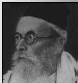
מרן ה"חזון איש" זצ"ל