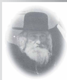
מן הבית ישראל זיע"א

מנהגו של הבית ישראל זיע"א היה להתחיל את תפילת המנחה בערב שבת, עם זמן הדלקת הנרות בירושלים, ארבעים דקות קודם השקיעה, כך שאמירת 'לכה דודי' היה נאמר מבעוד יום קודם השקיעה.