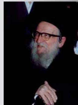
ה'מנחת יצחק' זצ"ל

והשיב (מנחת יצחק ט, כ), שכל הטעם שמי שמדליק מבעוד יום צריך לקבל עליו שבת מיד לאחר מכן, הוא כדי שיהיה ניכר שהדלקה זו היא לכבוד שבת. ואם כן בירושלים שהמנהג הוא להדליק נרות שבת בשעה זו, אף שהיום עוד גדול, אין צורך לקבל עליו שבת מיד, כיון שניכר בהדלקה שהיא לכבוד שבת, ולכן יכולים להתפלל מנחה אף לאחר ההדלקה. אולם נשים המקבלות שבת בהדלקת הנרות, הן צריכות באמת להתפלל מנחה לפני הדלקת הנרות.