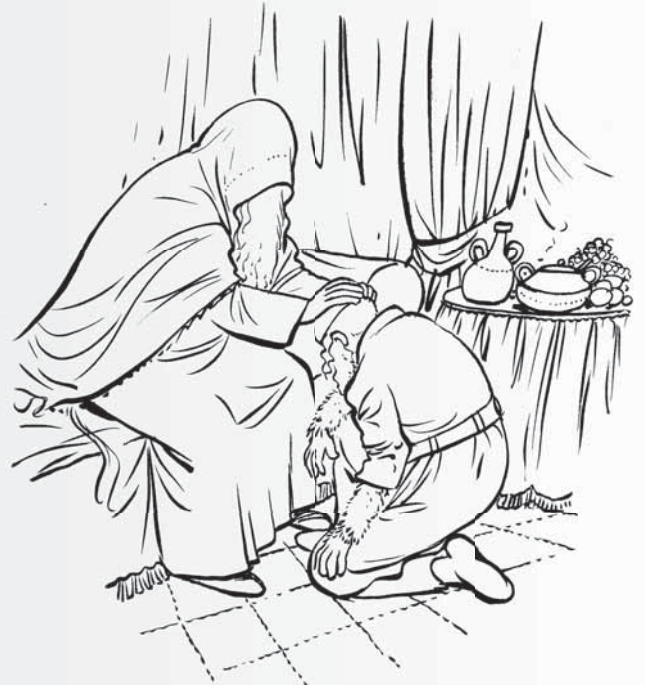
אף עשו הפסיד את הברכות?

ובלנו יודעים אף שבאמת יעקב אבינו הגיע לפני יצחק אביו, לבוש בגדים של עשו, ומעטף בפרת עור גדדי העצים, והביא מטעמים ליצחק אבינו, שאכן נתן לו את הברכה. ובעודו יוצא, נכנס עשו מהצד השני של הדלת, ולאחר ששומע על הברכות שהוציא יעקב אבינו במרמה, פוצח בנעקות שבר רמות ונשאות, ובבכי עז זועק חמם על הברכות שזלקוהו מנונו.