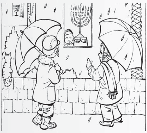
חג החנוכה נקרא 'חג חביב' אף בספר הרמב"ם, הפותח בהלכות חנוכה (פרק ד' הלכה י"ב) בלשון קדשו:

השבוע, נקבל בשמחה את חג החנוכה, החג האהוב והחביב, שמגיע תמיד בעצמו של החורף הקר והגשום. וזה הזמן להזכיר לנו את הקאב הגדול של יושבי ארץ הקדש, על כך שאנו עומדים כבר בשבוע שקדם חנכה, ועדיין לא מרגישים כלל שום הרגשה של חורף. הבה נרבה בתפלות לגשמי ברכה ונדיחה.