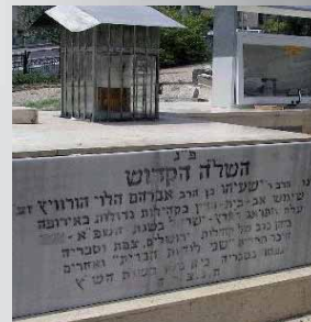
ציון השל"ה הקדוש בטבריה

"ומדת חסידות וקדושה יתירה היא, להיות מוכנים לצורך שבת במלאכות כבידות בחצות, ומחצות ואילך יהיה העסק הכל בקדושת שבת שכולו שבת, דהיינו בהתעוררות תשובה ובתיקוני מעשים ובלמוד התורה. ככה יעשו כל בני ביתו עד זמן הדלקת נרות, וסימונך ל"א תעשה כל מלאכה. כי בהתחלת קדושה מחצות ואילך, ובתוספת שעה כמוצאי שבת שצריך להוסיף מקודש אל החול, הרי ל"א שעות".