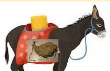
חֲמֹר (עם ככרות) לֶחֶם וְנֹאד-יִין,