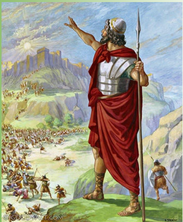
31 מלכים שכבשו יהושע בארץ-כנען